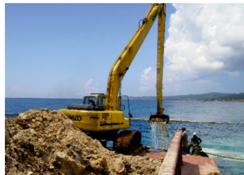
Dragado de arrecifes coralinos para la ampliación de un muelle de cruceros, en la zona cercana a Banco Cordelia, sitio de agregación de peces y hábitat de la especie cuervo de venado la cual según CITES están en estado de amenaza crítica.

En el caso específico del caso del muelle de cruceros, las autoridades han procedido a la citación de las partes trasgresoras; los responsables deberán cumplir con un serie de medidas compensatorias, entre las que resaltan el apoyo a organizaciones de la zona para el desarrollo de campañas educativas, así como el pago de un canon para promover la investigación sobre el estado de los arrecifes de la zona colindante al área dañada y a su vez la Empresa a cargo de las obras deberá de dar cumplimiento estricto de las medidas de mitigación.