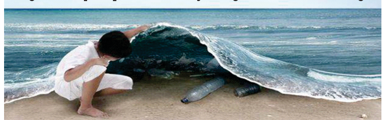
Un mensaje ecológico resumido en ésta imagen

Puesto que la EA se basa en valores, debe incentivar a las personas a ser receptivas a otras concepciones de la realidad. Esto se logra únicamente mediante una conciencia real de que la visión propia puede no ser compartida. Implica el respeto por las opiniones ajenas y el valor de la diversidad en sí misma.